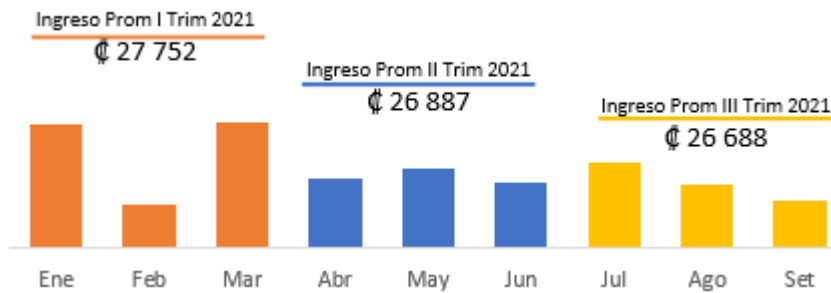
Gráfico N° 4 Ingreso promedio por trimestre en millones de colones

Fuente: Tablero de monitoreo (montos en millones de colones)