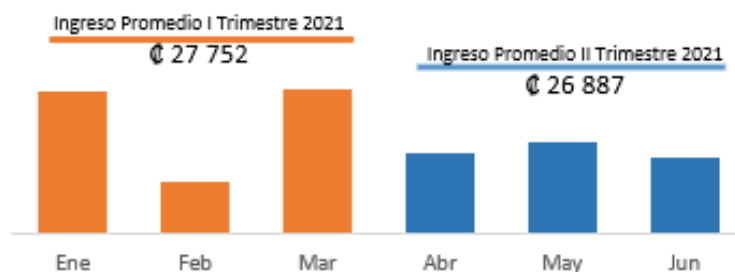
Gráfico N° 4 Ingreso promedio por trimestre en millones de colones

Fuente: Tablero de monitoreo (montos en millones de colones)